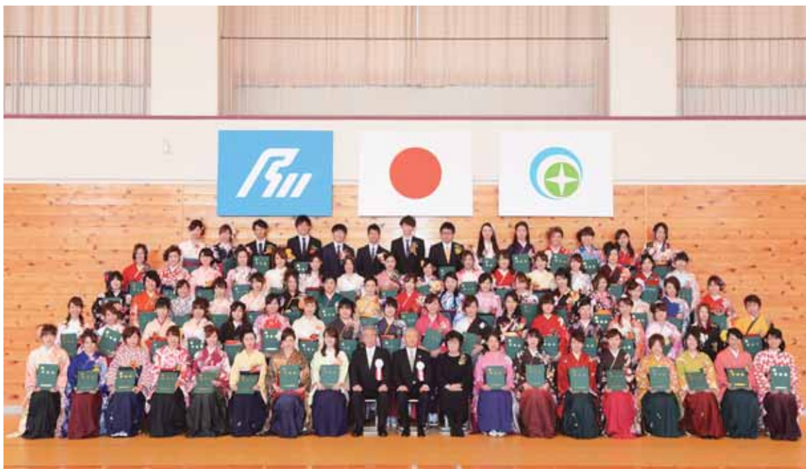
第 11 回卒業式 (平成 26 年 3 月 15 日)