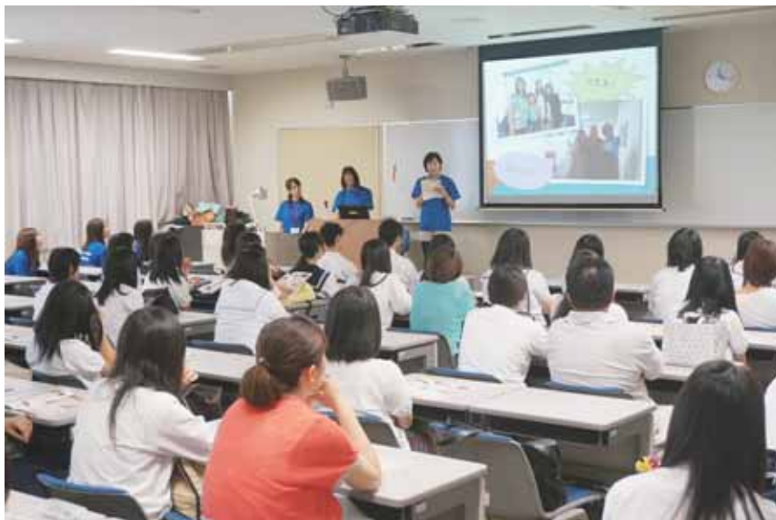
オープンキャンパス（平成 25 年 7 月 20 日）