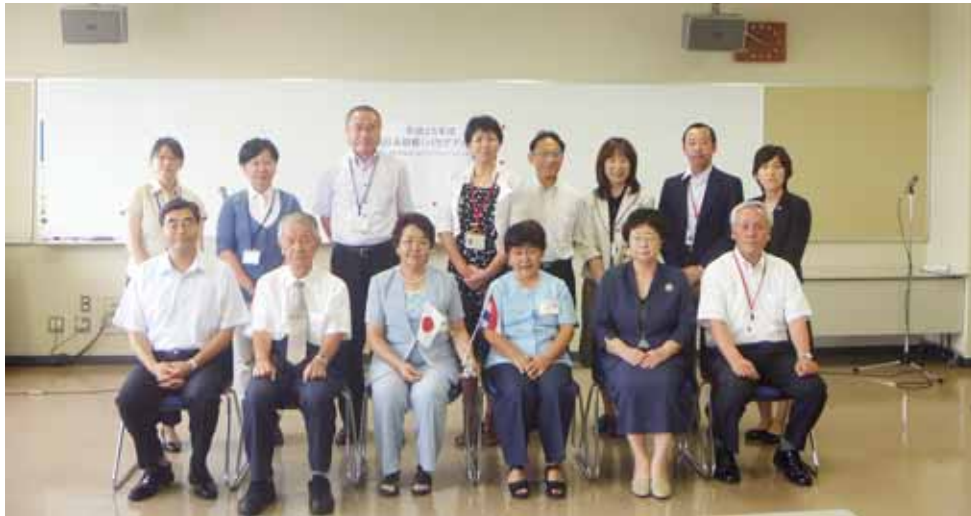
JICA 日系研修 (平成 25 年 7 月 16 日～8 月 9 日)