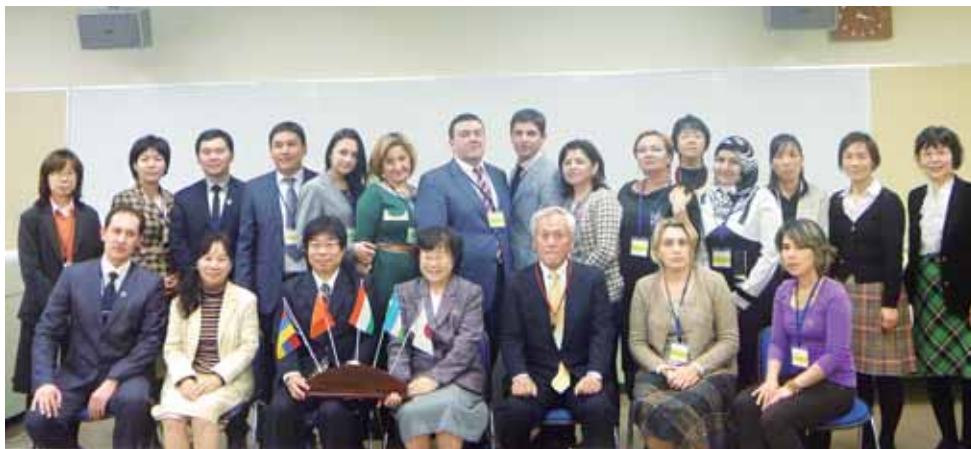
JICA 中央アジア・コーカサス混成青年研修(平成 25 年 11 月 28 日～12 月 10 日)