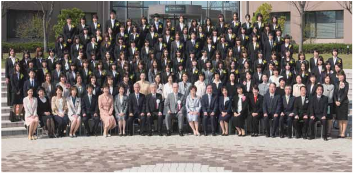
第 14 回入学式（平成 25 年 4 月 5 日）