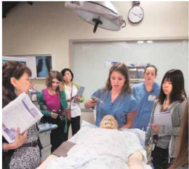
第8回夏期アメリカ看護研修(平成25年8月26日～9月8日)